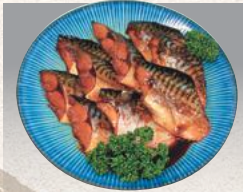
さば煮付 小 ¥198(¥194) 大 ¥297(¥291)