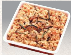
山菜おこわ 3合 ¥1,980(¥1,944)