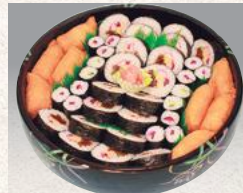
巻き寿司(いなり入り) ¥2,970(¥2,916)