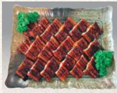
うなぎ蒲焼き 時価