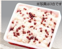
おこわ 1合 ¥495~(¥486)~