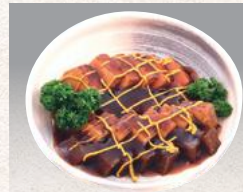
焼き豆腐とこんにゃくの煮物 ¥2,530(¥2,484)