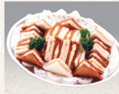
サンドイッチ 中 ¥1,980(¥1,944) 大 ¥2,310(¥2,268)