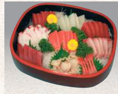
刺身盛合せ 中 ¥3,520(¥3,456) 大 ¥4,070(¥3,996)