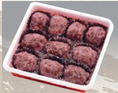
あんころ餅 10個 ¥1,320(¥1,296)