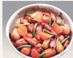
イカと里芋の煮物 ¥2,860(¥2,808)